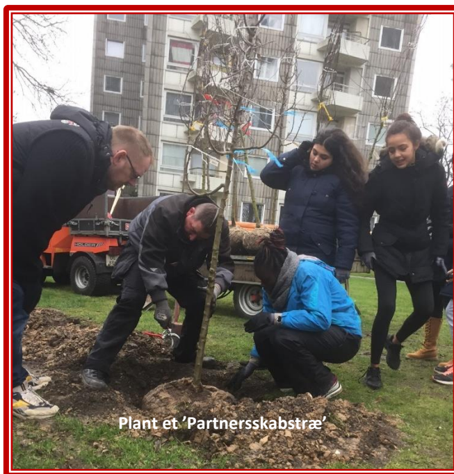
Plant et 'Partnerskabstræ'

Der er i efteråret 2017 plantet yderligere 8 'partnerskabstræer' i Bellahøj Syd hos SAB I&II efter sammen koncept som i Bellahøj Nord.