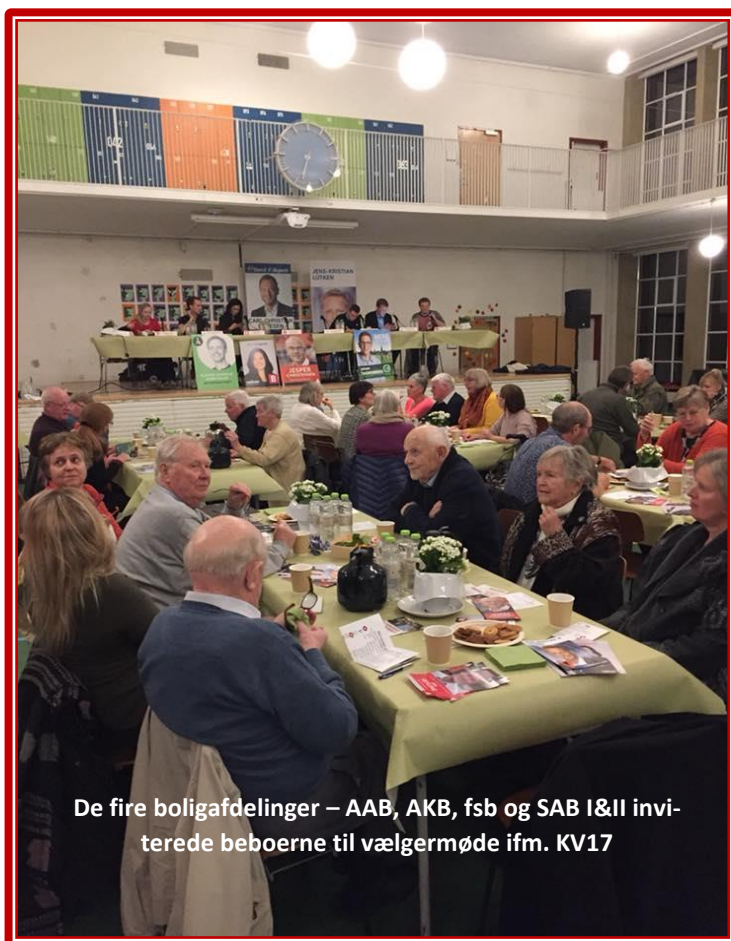
De fire boligafdelinger – AAB, AKB, fsb og SAB I&II inviterede beboerne til vælgermøde ifm. KV17